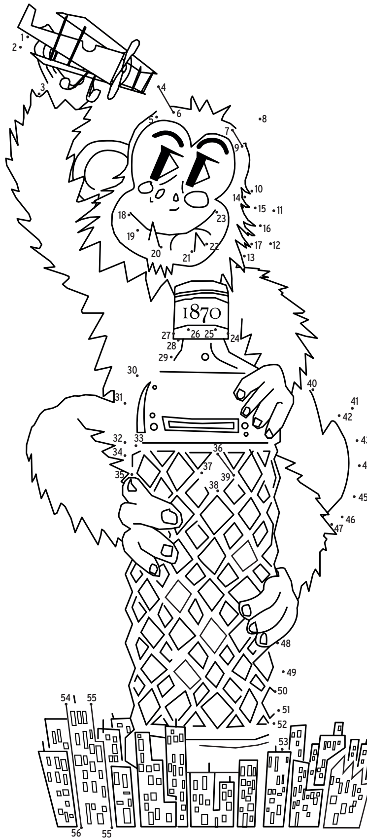
EI DIMONI MONÍSSIM