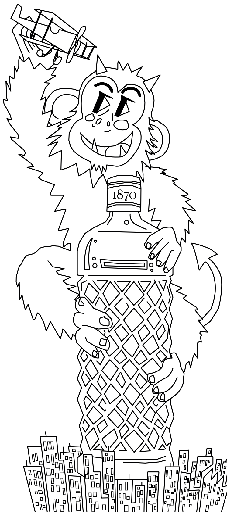
EI DIMONI MONÍSSIM