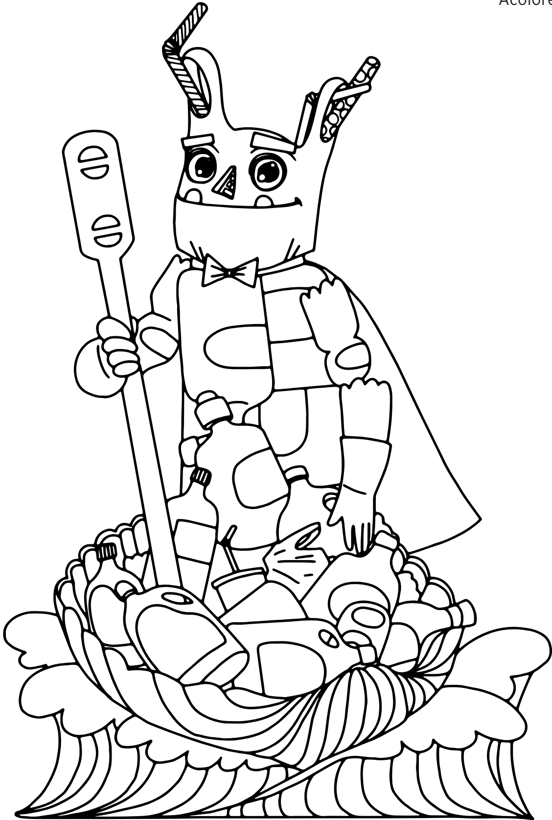
EI DIMONI DEL MAR