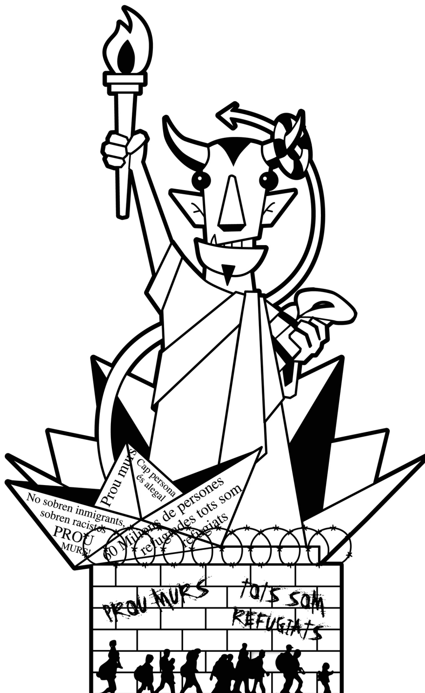
DIMONI AIXECA MURS