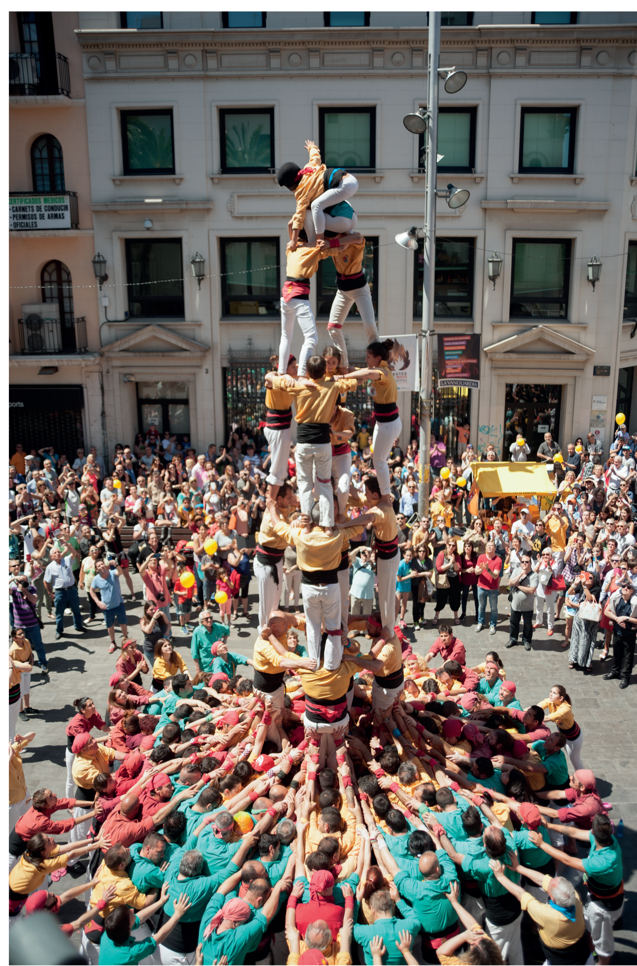
Castellers. Festa Major. 1956 Desconegut - Museu de Badalona. Arxiu Josep M. Cuyàs