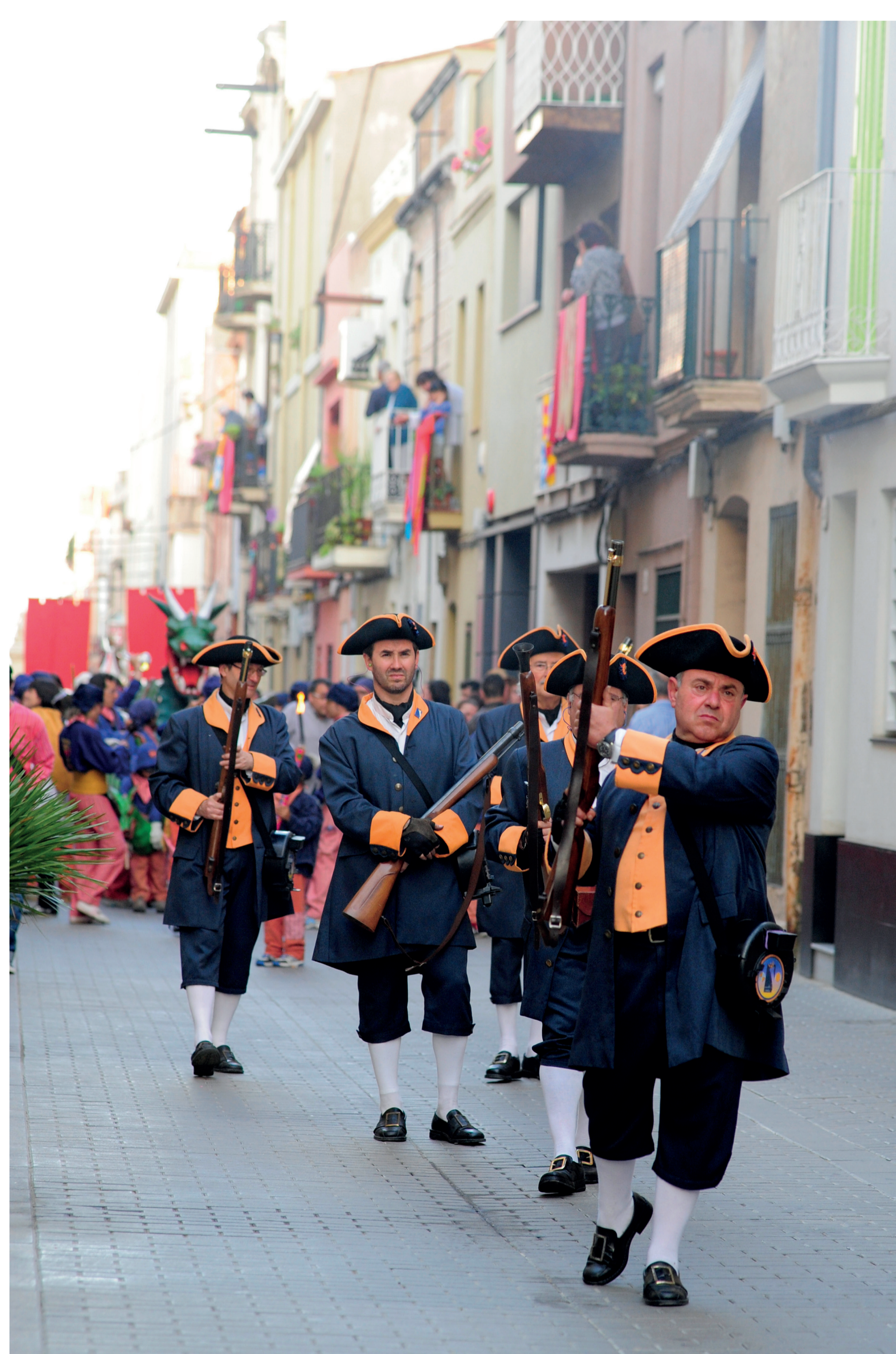
Miquelets de Badalona durant la Passada del Sant del 2011 al carrer del Carme

Antigament, els galejadors passejaven per la Vila disparant les seves escopetes per anunciar i celebrar la festa. Els trabucaires és l'adaptació que se n'ha fet i que ha adoptat diferents models des dels qui van vestits de pagès català fins als qui ho han adaptat com a ball parlat i que es coneix com a ball d'en Serrallonga. Porten un trabuc on col·loquen pólvora i, amb l'ajuda del gallet, provoquen grans explosions.