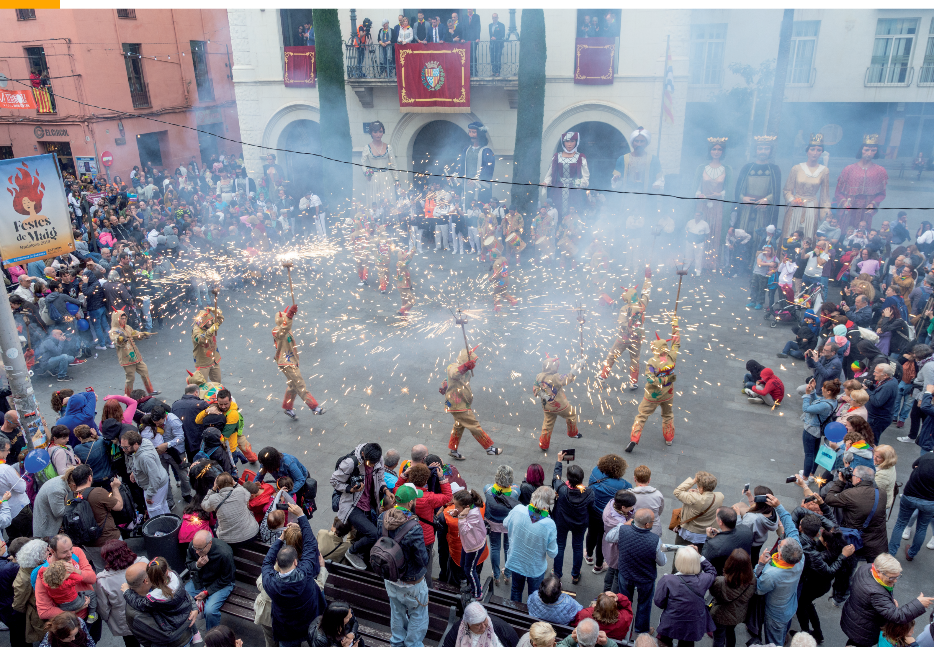
Ball de Diables lluint a la plaça de la Vila a les Festes de Maig del 2019