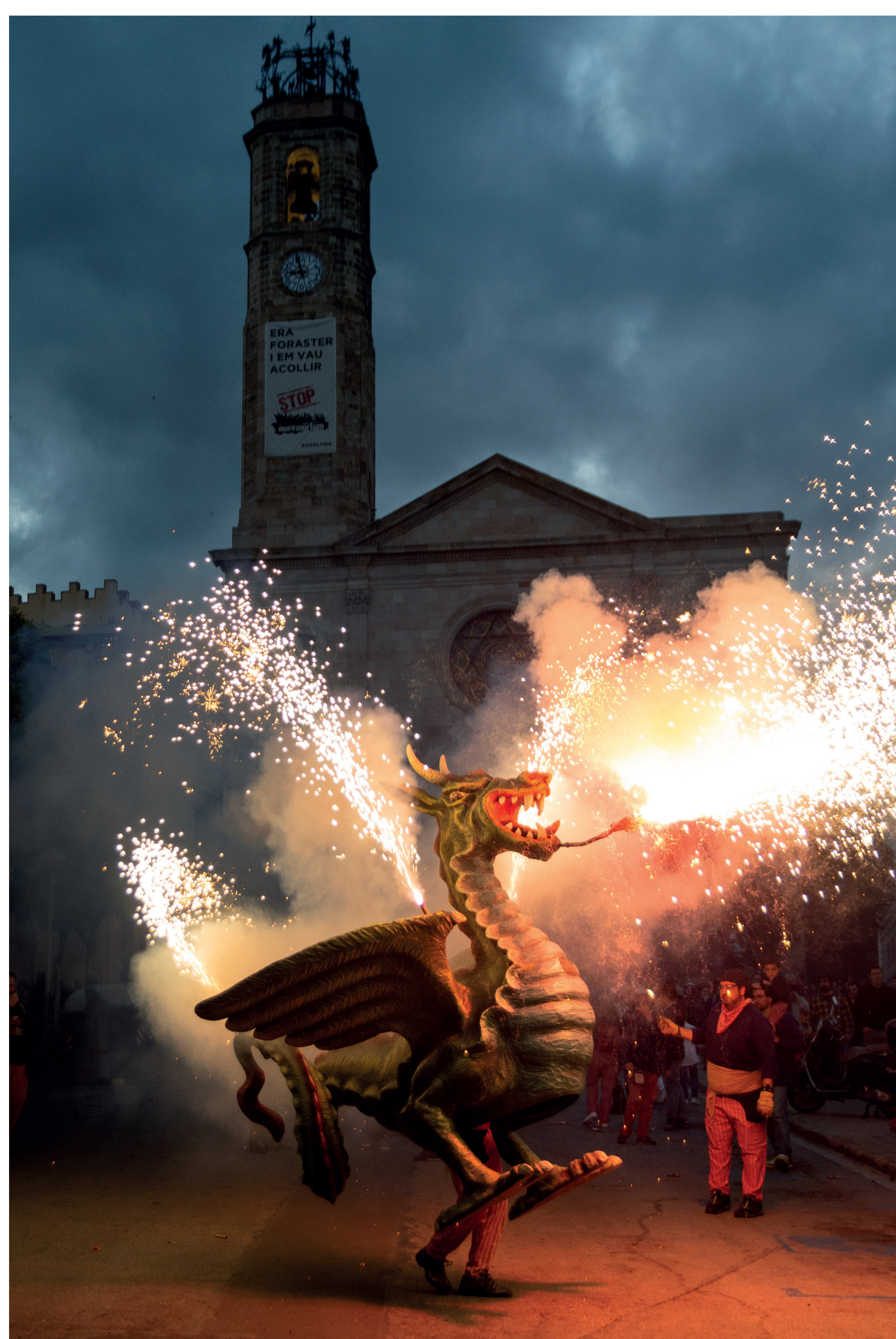
Dragolins durant les Festes de Maig del 2015