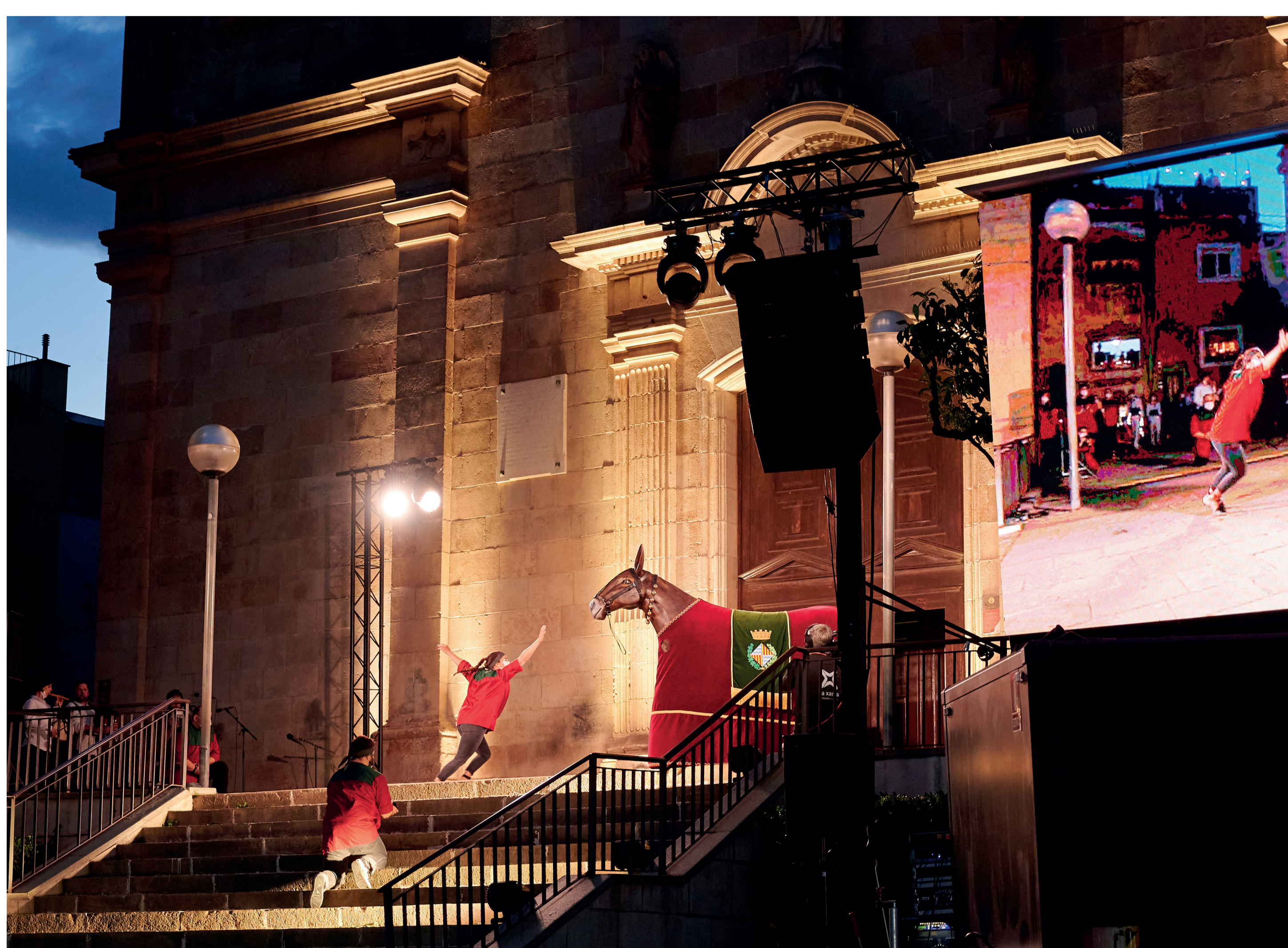
Mulassa durant la Nit de Sant Anastasi adaptada que es va fer l'any 2021

A Badalona s'estrena la Mulassa de Badalona l'agost del 2020 el dia de Sant Roc fent una ofrena a l'ofici en el seu honor. És una figura simpàtica que neix amb la intenció d'aportar a la festa un element més juganer i trapella que amb els pocs anys de vida ja s'ha guanyat els cors de grans i petits.